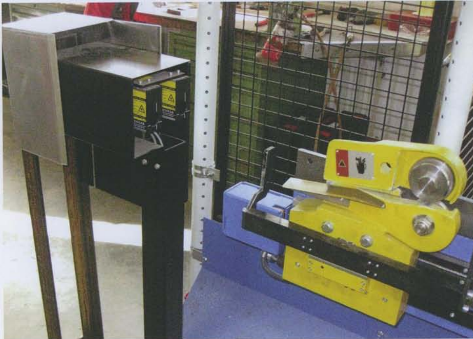
Der Klemmbereich wird durch ein dreidimensionales Laserschutzfeld abgesichert; hier im Bild ist der Akas-SBMA-Sender von Fliessler zu sehen.

Elektronik auch die Überwachung der gesamten Sicherheitsfunktionen. Die integrierte Kompaktsicherheitssteuerung überwacht sämtlich Not-Aus-Funktionen, das eingesetzte Sicherheitsfußpedal, die Rückführkreise der Stellglieder wie auch die Schleichganggeschwindigkeit. Weitere sonst benötigte Sicherheitssteuerkomponenten entfallen bei dieser Lösung. Die Reaktionszeit von nur 1,5 ms im „worst case“ erlaubt einen sehr kurzen Übergang zwischen Eilgangs- und Arbeitsgeschwin-